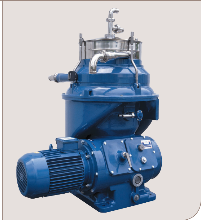
Σχ. 1 UVPX 510 πλήρες με κινητήρα

Στον τυπικό εξοπλισμό περιλαμβάνονται τα εξής: μικροδιακόπτης ασφαλείας, σετ φλαντζών του μπολ, σετ εργαλείων, σετ ρυθμιστικού δίσκου για την έξοδο νερού, πόδια αγκίστρωσης και δοχείο μετατόπισης νερού.